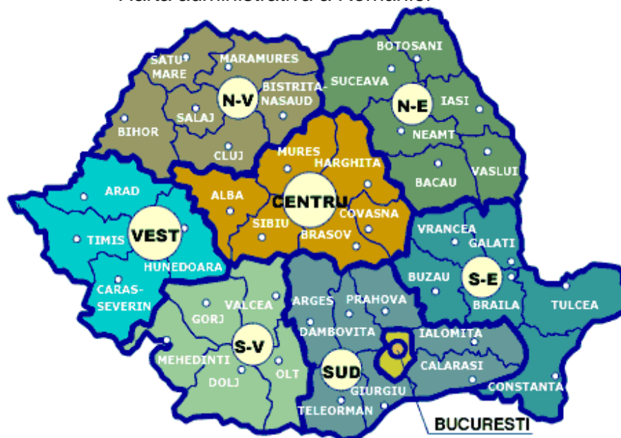
Harta administrativă a României

România este organizată din anul 1998 și în 4 macroregiuni, conform nivelului de diviziuni ale statelor membre a Uniunii Europene, prezentate în figura de mai jos. Macroregiunile, ca și regiunile de dezvoltare nu au un statut administrativ propriu-zis și o formă de guvernare sau administrare proprie, ele existând doar pentru colectarea statisticilor regionale.